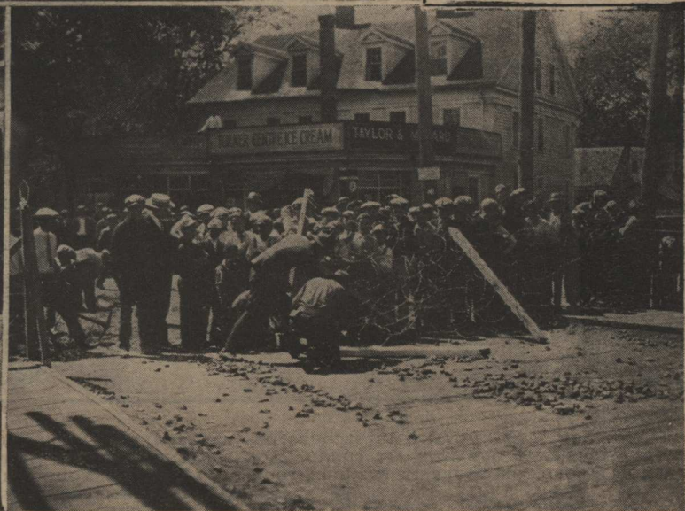
En d'autres points, les miliciens ont tendu des fils de fer barbelé pour arrêter l'élan des émeutiers. On remarque sur le sol les pierres qui ont été jetées aux défenseurs de l'ordre.

Or, on n'ignore pas que les États-Unis traversent une crise cotonnière assez grave — une crise de richesse. Les pays ne doivent pas être trop riches et l'excès d'abondance peut leur faire du mal, comme, aux êtres humains, la trop bonne chère : la récolte dans les États du Sud a été si belle que les prix se sont effondrés. D'où des troubles économiques graves qui n'ont pas tardé à se transformer en troubles politiques dans certaines cités comme celle de Manville, proche de Providence.