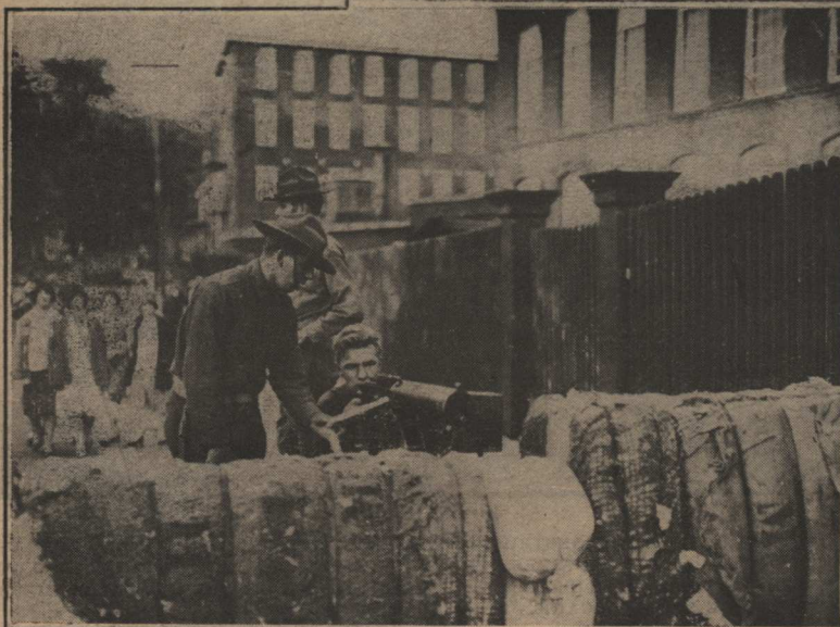
Les miliciens ont braqué leurs mitrailleuses derrière des murailles de balles de coton, formant ainsi des défenses infranchissables autour des usines que l'on voulait protéger des tentatives des grévistes.

Un retranchement improvisé à Manville, où au cours des échauffourées, une douzaine de personnes ont été plus ou moins sérieusement blessées.