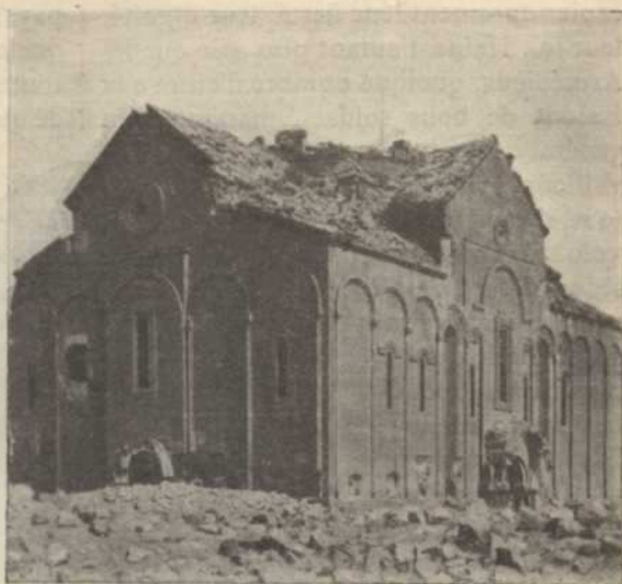
LA BASILIQUE D'ANI

D'autres Arméniens pâtirent des conséquences de la guerre. Ceux qui durent quitter Van lorsque les Russes évacuèrent cette ville périrent en foule soit à la suite de privations, soit sous les coups des Kurdes. Et quand les survivants parvinrent au Caucase, ils étaient encore trop nombreux pour être secourus effica-