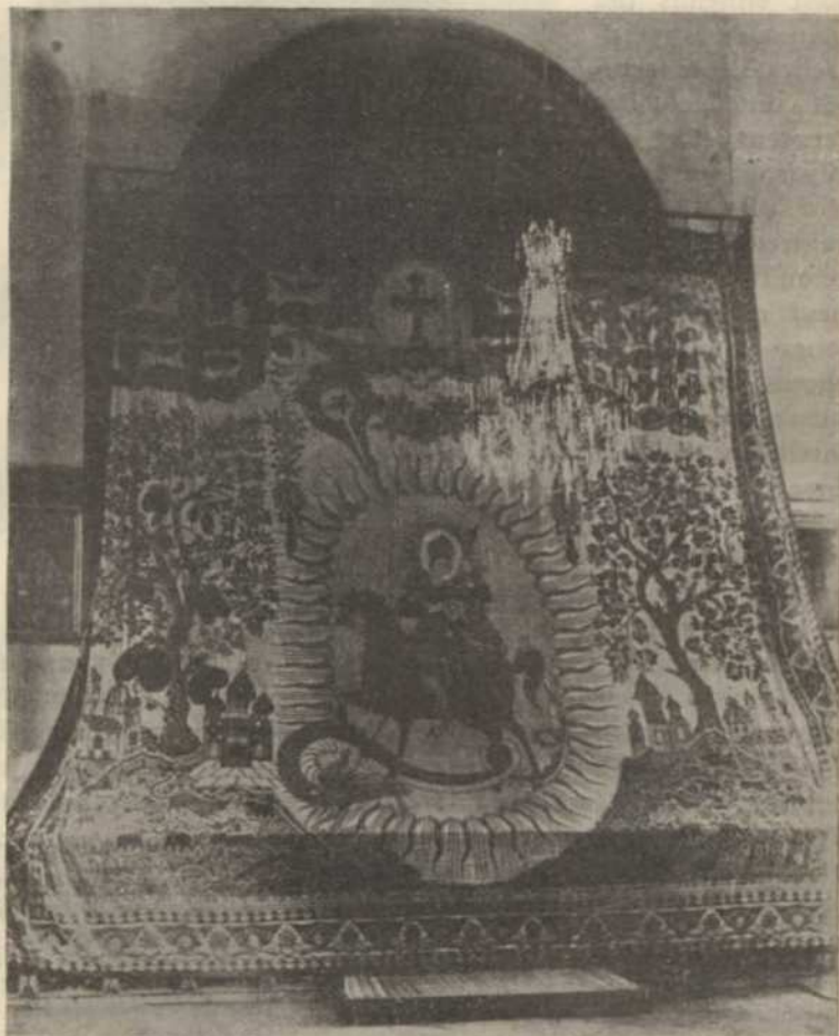
RIDEAU COUVRANT LE SAINT AUTEL, A LA CATHÉDRALE D'ETCHMIADZIN