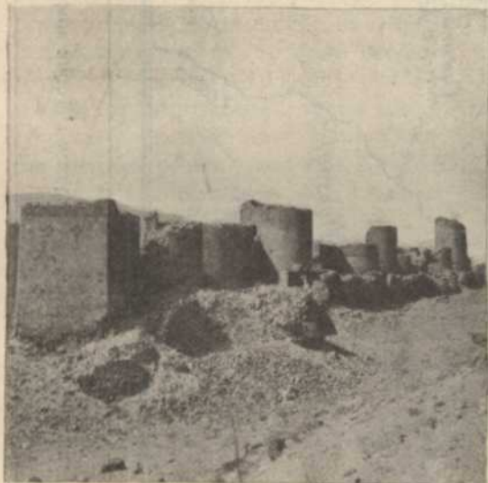
LES FORTIFICATIONS D'ANI, CAPITALE DES BAGDATIDES

A partir de 1305, l'Arménie commence sa marche au calvaire. Les Mongols de Gengis Khan déferlent sur cette région