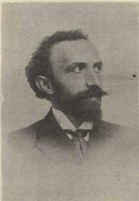
LE POÈTE ARCHAG TCHOBANIAN, DIRECTEUR DE L'« ANAHIT », REVUE ARMÉNIENNE

Plus près de nous, ce sont encore : Bedros Tourian, le sensitif; Kamar-Katiba, l'énergique; Khatchatour Abovian, dont le cœur saigne dans les « Blessures de l'Arménie », et Béchik-tachélian, au nocturne tragique. Enfin, parmi les modernes, maints bons poètes, d'un esprit très près du nôtre, continuent dignement les traditions de leurs aînés tout