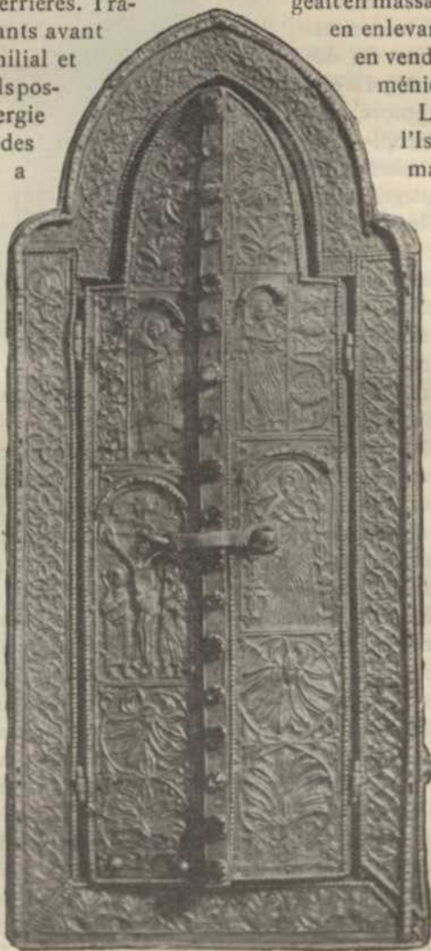
RELIQUAIRE CONTENANT UN FRAGMENT DE LA SAINTE LANCE, A LA CATHÉDRALE D'ETCHMIADZIN

Les alliés ne sauraient, hélas! secourir ce peuple sacrifié. Il n'en existera plus un seul représentant dans la Turquie