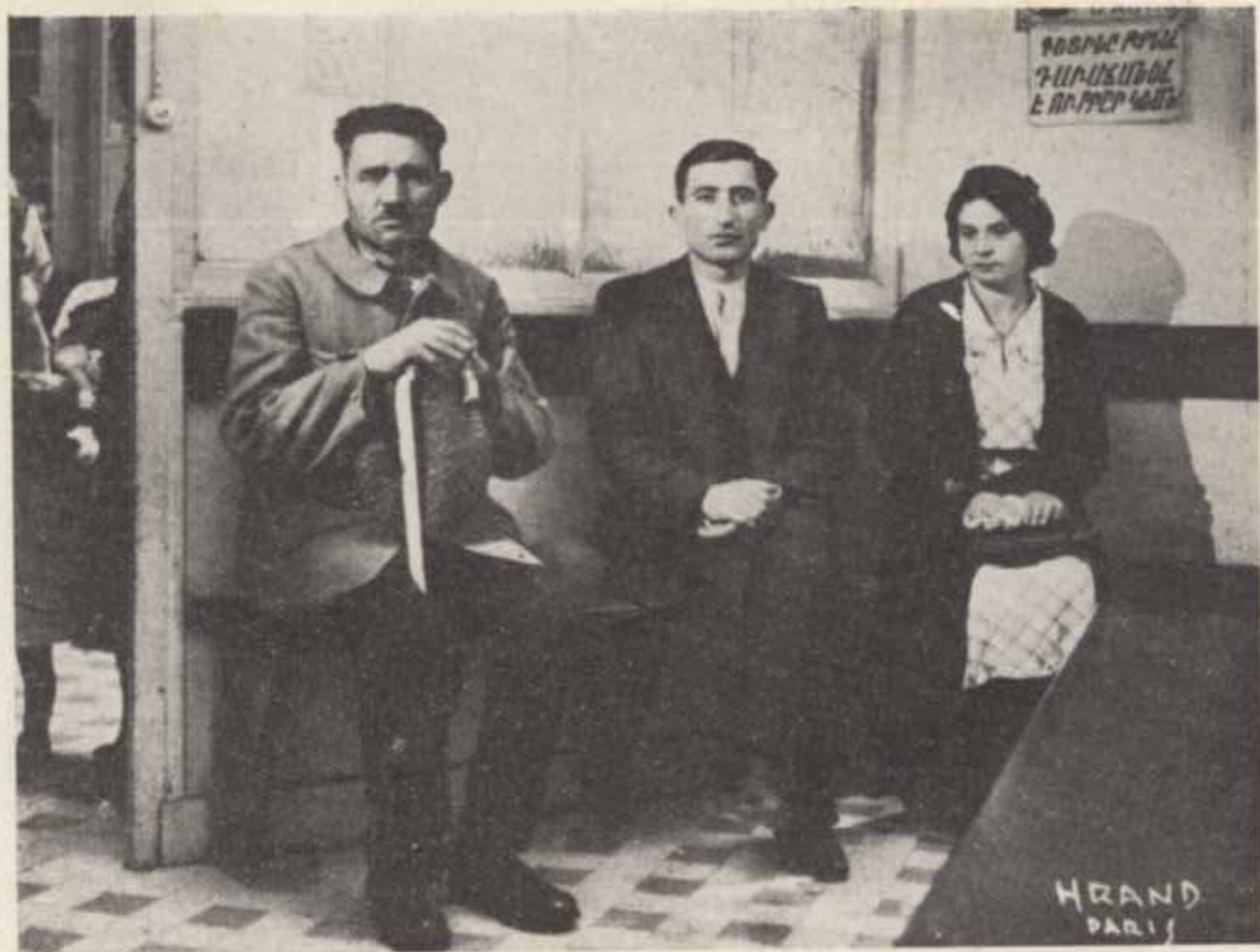
ՍԳԱՍՄԱՆ ՍՐԱՀԻՆ ՄԵԿ ԱՆԿԻՆԸ ԻՐԵՆՑ ԿԱՐԳԻՆ ՍԳԱՍՈՂ ՀԻՌԱՆԳՆԵՐ