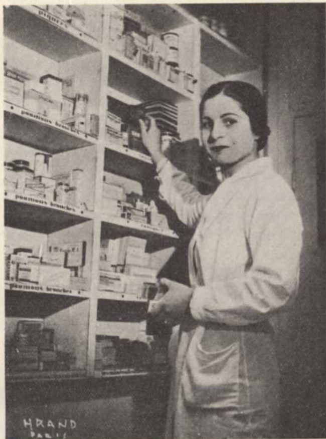
ԳԵՂԱՐՄԱՆԻ ԱՄԿ ԱՆՈՒՆԵՐ