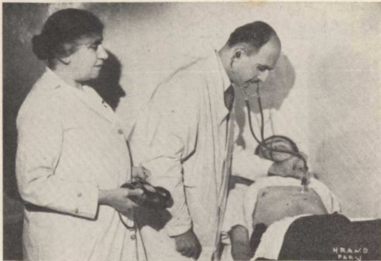
ԲՈՒՅԱԳԱՆ ՔՆՆՈՒԹԻՒՆ ՄԸ ԲՈՒՅԱԲԱՆՆԵՆ ՄԷ՞՞՞