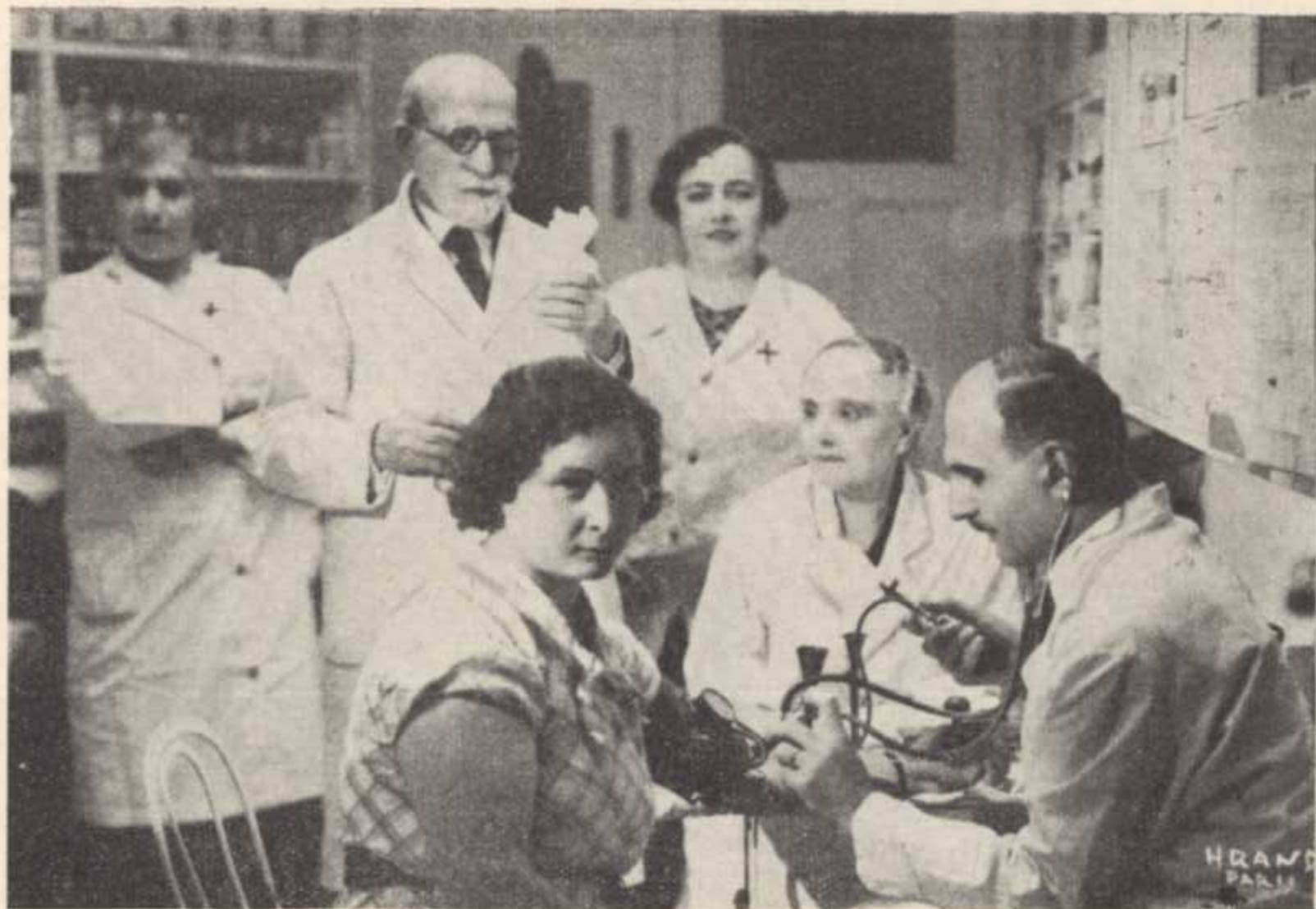
Բժշկական փննութիւն մը բոնիօքսնին մէջ